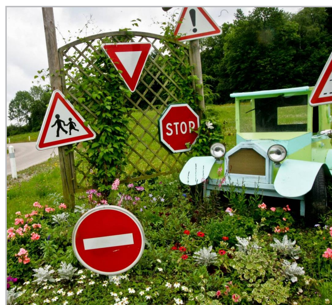
Les écoliers se sont impliqués dans un projet d'éducation à la sécurité routière.

C'est à ce prix, en n'oubliant personne, que Vaxoncourt s'assure la réputation d'un village où il fait bon vivre.